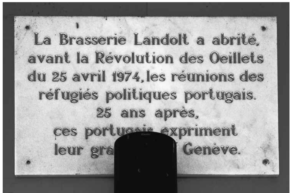
A cet emplacement s'élevait la Brasserie Landolt...

On ignore totalement si Carl Vogt prenait sa bière chez Landolt – c'est bien probable – ou si son fils venait y égratigner les francs-maçons. William Vogt fut un de ceux qui furent chargés par Hodler, en 1886, de «chauffer» Emil Landolt pour décorer sa brasserie du Crocodile au n° 100 de la rue du Rhône. Les guides Baedeker de la fin du XIX e siècle, qui signalaient toujours les établissements délivrant de la bière de Munich, n'oublent d'ailleurs ni la Brasserie Landolt, ni le Crocodile. Les guides français précisent «en face du Jardin des Bastions».