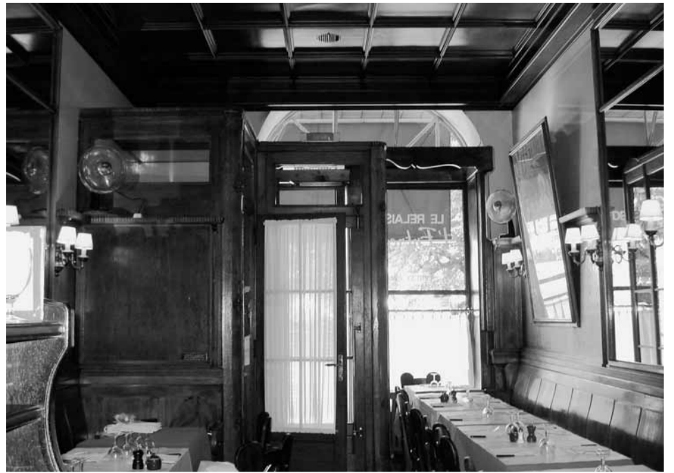
Le Relais de l'Entrecôte, successeur de la Bavaria.